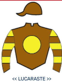
<< LUCARASTE >>

1 LA NORTINA 5 5 7 4 56 77 5 5 7 4 56 77 0 0 0 0 12 12 $16.880.000