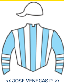
<< JOSE VENEGAS P. >>

4 GIULIETTA AMORE 3 0 8 4 31 46 0 0 2 0 19 21 0 0 1 1 8 10 $4.517.000