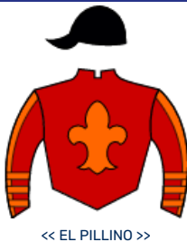
<< EL PILLINO >>

3 KAT FEVER 2 0 2 1 20 25 2 0 2 1 17 22 0 0 1 1 4 6 $5.053.000